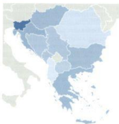
SLIKA 1 Penetracija osiguranja u 2022. godini

Tržišta osiguranja analiziranih 11 zemalja su potpuno različita po gotovo svim parametrima, čak ni najveće kompanije ne pripadaju istim evropskim grupacijama. Ipak, na osnovu prikazanih podataka može se zaključiti da je Srbija po svim parametrima u sredini posmatrane grupe.